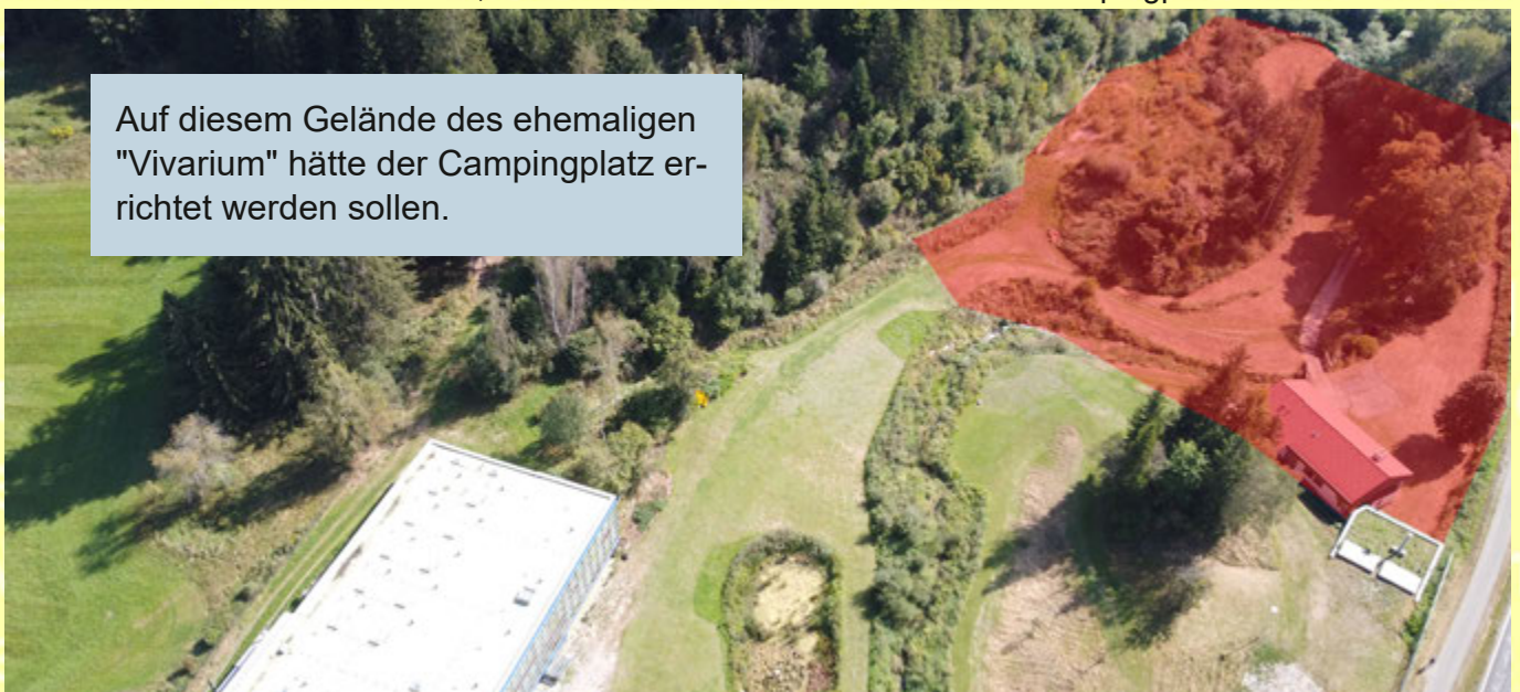
Auf diesem Gelände des ehemaligen "Vivarium" hätte der Campingplatz errichtet werden sollen.

Dem Vernehmen nach soll jetzt in St. Lambrecht ein Campingplatz errichtet werden.