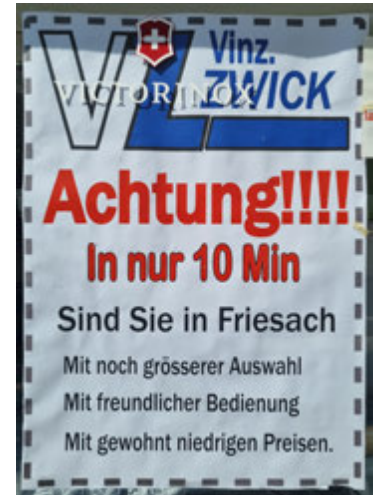
Ein trauriges Überbleibsel, das hoffentlich eine Ausnahme bleibt.

Das zweite regionale Nebenzentrum im Bezirk ist am Aussterben. Viele Geschäfte von einst existieren nicht mehr und Wohnungen am Hauptplatz stehen leer. Wer durch den Markt spaziert, wird viele einstmalige Geschäftsflächen entdecken, die nicht mehr als solche genutzt werden. Teils stehen sie dafür auch nicht mehr zur Verfügung.