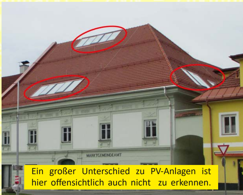
Ein großer Unterschied zu PV-Anlagen ist hier offensichtlich auch nicht zu erkennen.

Ein Neumarkter Hauseigentümer hat beim Landesverwaltungsgericht einen negativen Bescheid der Marktgemeinde beeinsprucht und Recht bekommen. Anstatt nun diese Gerichtsentscheidung zu akzeptieren und sich den Erfordernissen der Zeit anzupassen, wird sie, soweit wir es in Erfahrung bringen konnten, von einer namhaften Grazer Anwaltskanzlei beim Höchstgericht bekämpft. Was bitte hat die Gemeinde davon? Alles auf Kosten der Steuerzahler und gegen die Bürger- und Umweltinteressen! Wir fragen uns schon, was da im BGM vorgeht und warum er eine Anpassung der Ortsbildverordnung so vehement entgegen steht.