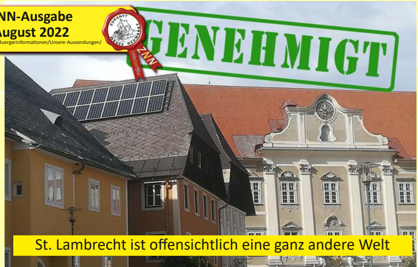
St. Lambrecht ist offensichtlich eine ganz andere Welt